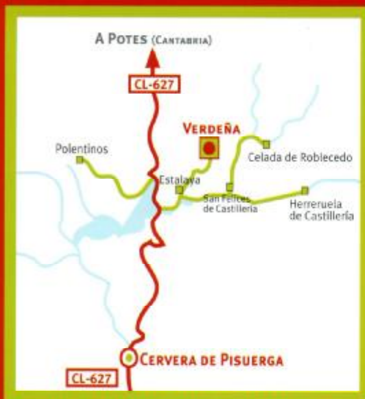
> SITUACIÓN DE LA CASA DEL OSO CANTÁBRICO

¡Ven a visitarnos! Estamos en Verdeña, en la Montaña Palentina