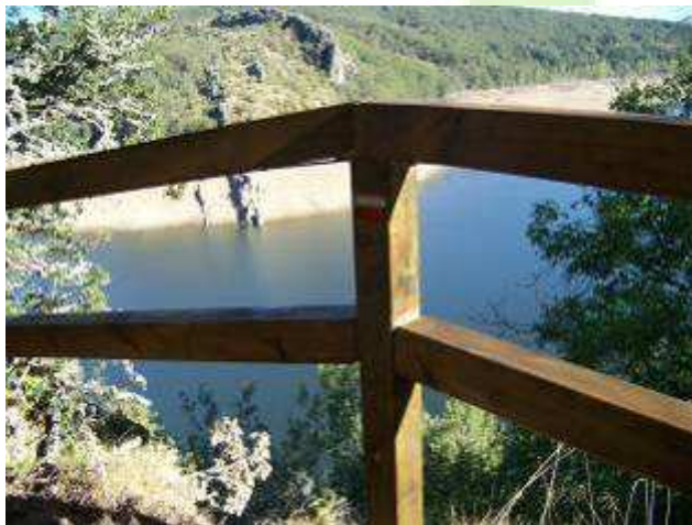
El GR 1 transcurre junto al embalse de la Requejada en su tramo entre Vañes y Arbejal

En total el GR 1 palentino recorre casi 90 Km. entre preciosos valles y collados, programados en un total de 6 etapas que visitan un total de 16 pueblos en su camino desde el límite con Cantabria en las cercanías de Salcedillo hasta el límite con la provincia de León en la Cruz Armada.