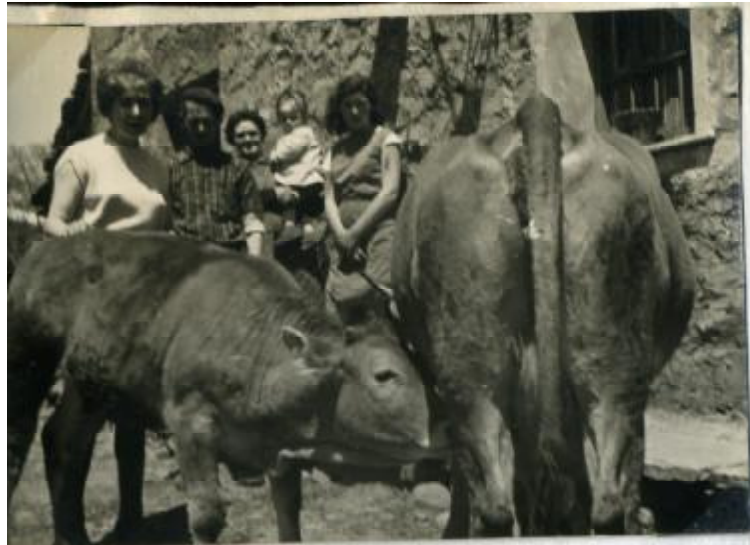
Dos buenas muestras del animal más importante de nuestras ganaderías Son de raza parda alpina