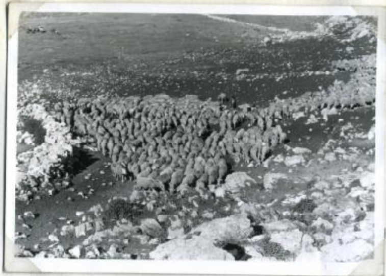
Rebano de ovejas merinas. Provenientes de Extremadura vienen a nuestras Sierras a aprovecharse de los verdes pastos que en verano tienen.