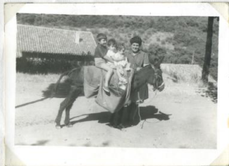
También exasean los jumentos. Se utilizan para llevar la leche, leña, o meriendas y... niños.