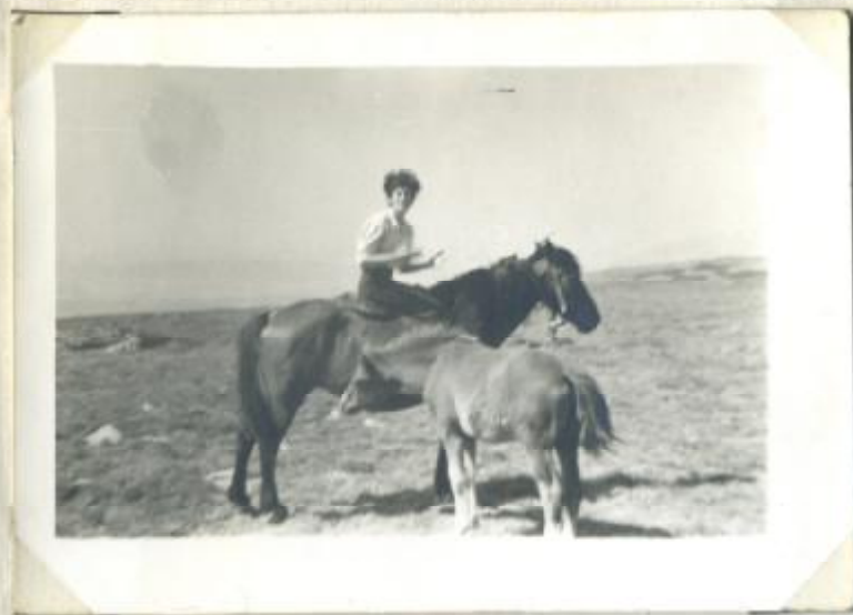
Yegua con su potro. Poco ganado caballar tenemos.